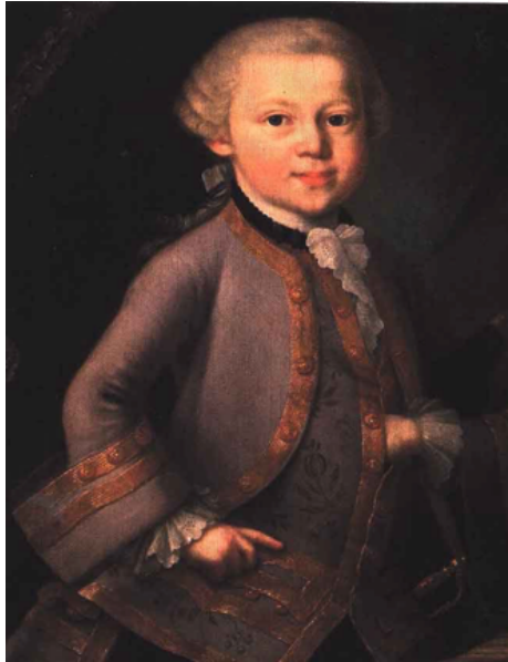
Wolfgang Amadeus Mozart alias 'Wolferl'