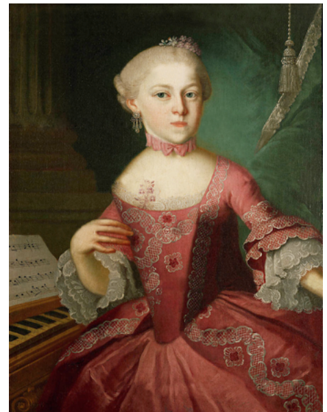
Maria Anna Mozart alias 'Nannerl'

Mozart jouit aujourd'hui d'une réputation mondiale et est toujours considéré comme un génie musical !